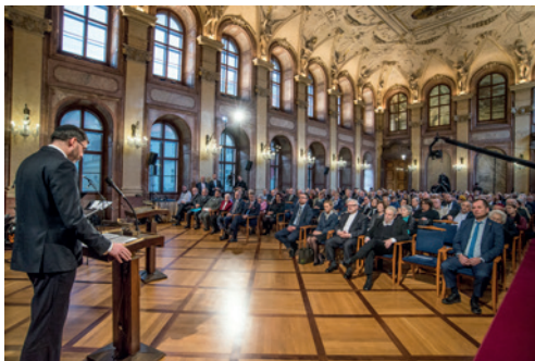
Den památky obětí holocaustu, Senát, 26. 1.

V pátek 8. března 2024 uspořádala Terezínská iniciativa v Pinkasově synagoze tradiční trýznu na připomenutí největší hromadné vraždy našich občanů za druhé světové války.