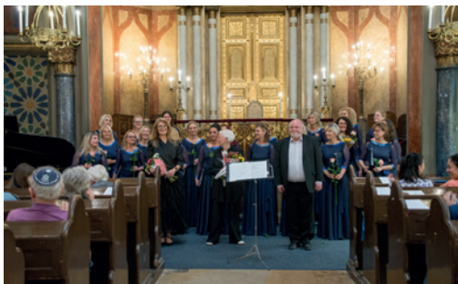
KDP Ezra – benefiční koncert v Jeruzalémské synagoze

Na podzim 2024 uspořádala KDP EZRA v Jeruzalémské synagoze benefiční koncert, jehož výtěžek byl zaslán do Izraele na pomoc kibucu KFAR AZA.