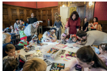
Purim pro děti – workshop