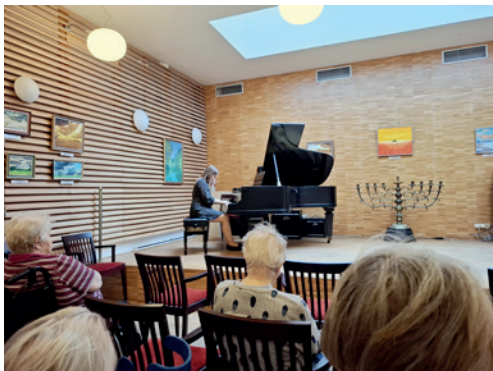
Koncert v DSP Hagibor

Pobytová služba Odlehčovací služby poskytuje nezbytný odpočinek rodinám nebo osobám pečujícím o svého člena – blízkou osobu v domácnosti. Klienty této služby mohou být jak senioři, kteří z důvodů snížené soběstačnosti a zhoršeného zdravotního stavu potřebují celodenní péči druhé osoby, tak dospělé osoby se zdravotním postižením, které potřebují celodenní péči druhé osoby. Rozsah sociální péče určuje § 44 zákona č. 108/2006 Sb. a § 10 vyhlášky č. 505/2006 Sb. Maximální délka pobytu je 3 měsíce.