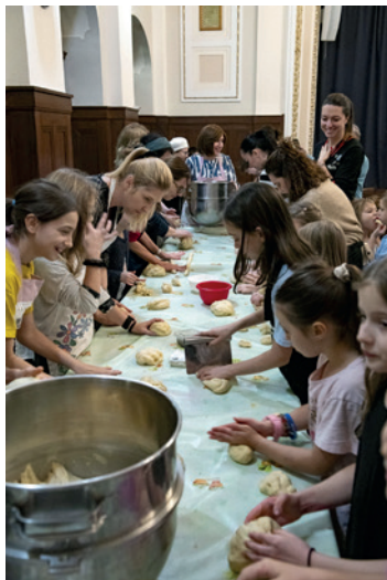
TKC – šabatový projekt