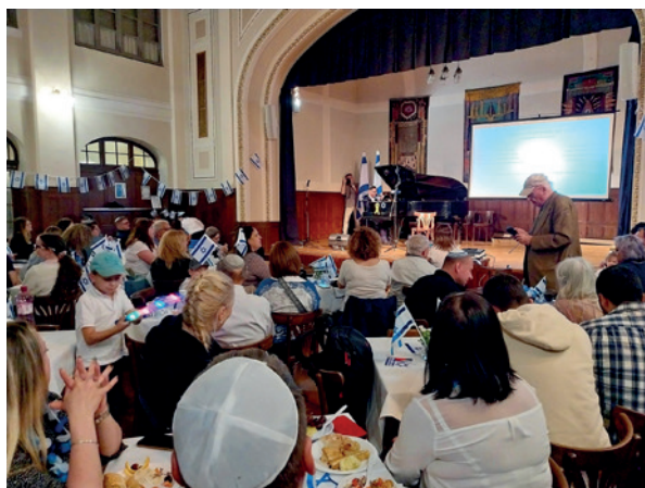
TKC – Jom haacmaut