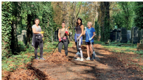
Nový židovský hřbitov – dobrovolnická akce

Starý židovský hřbitov na Žižkově (SŽHŽ) – za nejvýznamnější akci související s technickou správou a údržbou areálu lze v r. 2024 označit restaurování 47 poškozených a erodovaných historicky cenných náhrobků, vybraných převážně ve střední části hřbitovní plochy. Jednalo se o náhrobní kameny, které byly poškozeny vyvrácením, povalením, popraskáním nebo rozlomením, a také o náhroby se zajímavou symbolikou a výtvarným zpracováním. Několik těchto náhrobků bylo poškozeno živelnými událostmi při odlomení a pádu části korun stromů ve vichřici, jiné byly vyjmuty z nevhodně vytvořeného betonového lapidária a poté restaurovány a osazeny na svá původní místa s využitím historických záznamů.