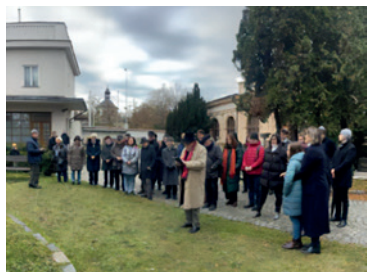
Tryzna za zahynulé na lodi Patria