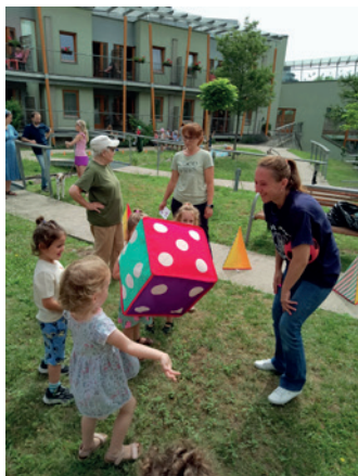
Sportovní den na Hagiboru

Společné pečení s klienty a s dětmi, hudební program s možnou aktivní účastí, AAA (animal assisted activities), Ateliér Golem – výtvarná dílna, taneční individuální aktivizace, trénink paměti, kreativní činnosti (navlékání korálků, tvorba šperků), kognitivní trénink, literárně-hudební kavárny, filmová setkání, kavárna s hostem, přednášky, předčítání, besedy, společenské hry – individuálně, práce s počítačem – individuálně, moderované debaty, slavení židovských svátků, narozeninové oslavy, vernisáže výstav, koncerty, divadelní představení, plesy, skupinové a individuální zpívání, nákupy včetně fakultativních, společné aktivity s dětmi z Bejachadu, výlety, programy na zahradě a na terase v jarním a letním období.