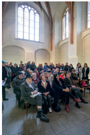
Tryzna v Pinkasově synagoze