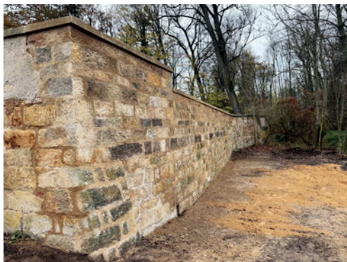
Oprava ohradní zdi na hřbitově v Jičíně