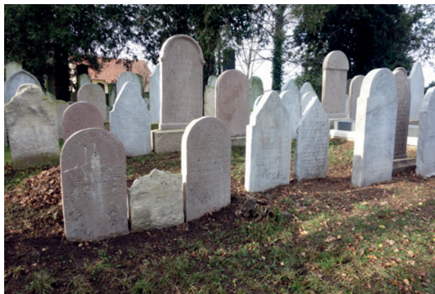
Restaurované náhrobky v Golčově Jeníkově

ŽOP zlepšuje komunikaci se svými členy – od roku 2018 prostřednictvím e-mailu dostávají každý týden Zpravodaj/Newsletter. Jsou v něm informováni o společenských, kulturních a náboženských akcích a činnosti spolků.