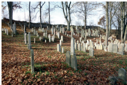
Židovský hřbitov v Polné

Mezi nejvýznamnější stavební a restaurátorské akce patřilo v r. 2024 pokračování postupné stavební a restaurátorské obnovy hřbitovních areálů v Golčově Jeníkově, Habrech, Hroubovicích, Kladně, Kolíně – starém i novém hřbitově, Litomyšli – Lánech, Načeradci, Neveklově, Novém Bydžově – starém hřbitově, Pardubicích, Písku, Poličce, Polné, Protivíně, Přistoupimi a Starém Městě p. L. Ve významném rozsahu byly opravovány a doplňovány ohradní zdi na hřbitovech v Jičíně, Malešově, Mladé Boleslavi a v Praze-Uhřetěvsi . Významným počinem se stane celková rekonstrukce a znovuobydlení hrobnického domku v Litni , kde prozatím probíhaly přípravné práce, sondy a projektování. Dalšího pokroku doznala i stavební a restaurátorská obnova synagogy v Čáslavi, prováděná prostřednictvím NF Dagmar Lieblové.