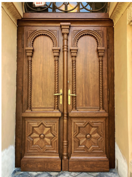
Restaurátorská obnova synagogy v Čáslavi