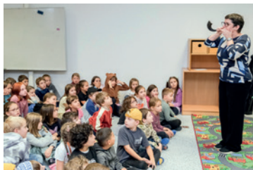
Oslava Roš Hašana

Také v roce 2024 dotovala ŽOP významným způsobem činnost Lauderových škol (26,9 % rozpočtu školy). Lauderovy školy představují jedinečný vzdělávací projekt určený dětem, žákům a studentům se zájmem o výchovu v duchu židovství. Základní škola vznikla v roce 1997, od roku 1999 existuje gymnázium a od roku 2009 mateřská škola. Výuka na všech vzdělávacích stupních probíhá podle vlastního školního vzdělávacího programu Le chajim , vycházejícího z rámcových vzdělávacích programů pro předškolní, základní a gymnaziální vzdělávání, navíc obohacených o židovskou výchovu a hebrejštinu. Škola se profiluje jako komunitní a inkluzivní a v současné době čelí takovému převisu poptávky, že musí naneštěstí odmítat i zájemce z cílové skupiny. Na konci roku 2024 navštěvovalo MŠ, ZŠ a gymnázium Lauderových škol 396 žáků a studentů, dalších 80 dospělých a 50 dětských studentů bylo v tzv. e-šcole.