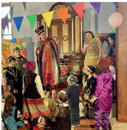
Divadlo Feigele – natáčení Purimu v Hartmanické synagoze