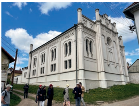
Synagoga v Golčově Jeníkově

Dne 11. srpna proběhl na území ČR sedmý ročník Dne židovských památek (DŽP). Záměrem této akce bylo zpřístupnit a zviditelnit několik desítek regionálních památek, synagog a hřbitovů, které buď nejsou volně přístupné, nebo prošly v nedávné době rekonstrukcí. Z tohoto důvodu byly do DŽP zapojeny i objekty opravené v projektu revitalizace židovských památek 10 hvězd. Veškeré objekty byly přístupné zdarma nebo za dobrovolné vstupné. Celkem bylo zpřístupněno na 53 místech po celé ČR 45 hřbitovů a 34 synagog a dalších objektů (včetně památek 10 hvězd).