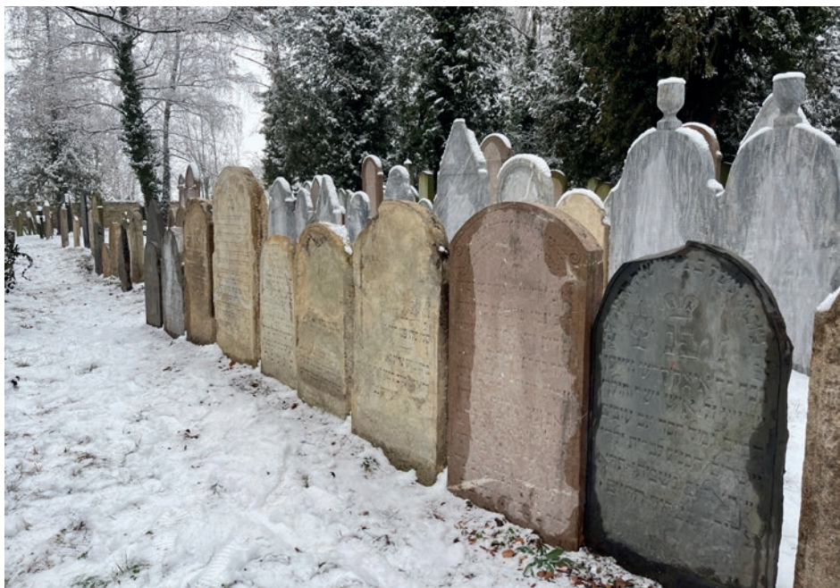
Židovský hřbitov v Golčově Jeníkově