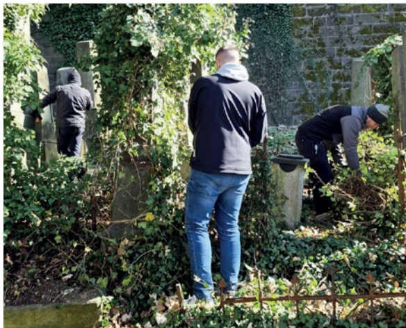
Židovský hřbitov v Turnově

ŽOP zlepšuje komunikaci se svými členy – od roku 2018 prostřednictvím e-mailu dostávají každý týden Zpravodaj/Newsletter. Jsou v něm informováni o společenských, kulturních a náboženských akcích a činnosti spolků.