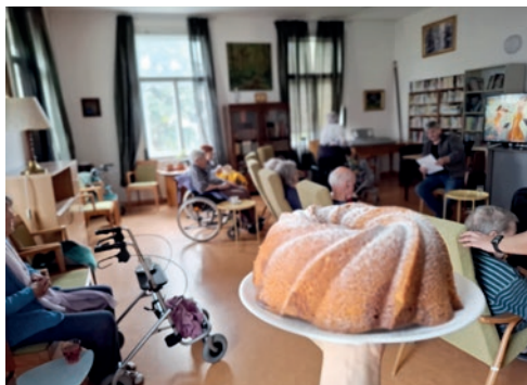
Bábovka na besedu

V roce 2025 nadále narůstal věk přeživších, což vedlo ke zvýšení počtu onemocnění i k rozvoji syndromu geriatrické křehkosti, který vyžaduje zvýšenou