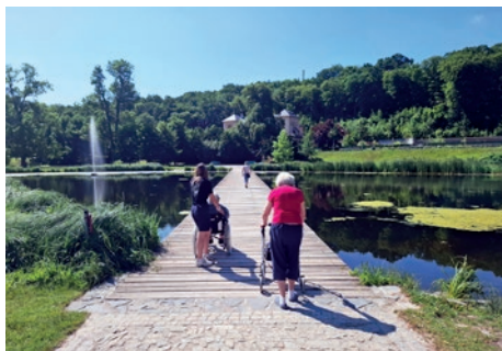
Výlet do Stromovky

Biografie – životní příběh: Zpracování životního příběhu klienta je časově náročné