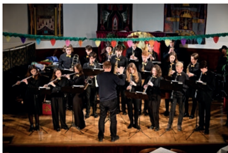
FeverBand, žakovský dechový bigband při ŽUŠ Ilji Hurníka