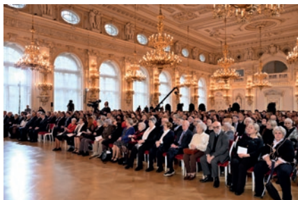
Den památky obětí holocaustu, Senát, 29. 1.