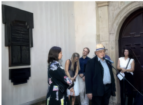
Obnovení pamětní desky Spravedlivý mezi národy

Noviny stručně informovaly o významných projektech, přinášely příspěvky k aktuálním politickým otázkám i informace o Federaci židovských obcí v ČR. Podrobně referovaly o výsledku hospodaření ŽOP za uplynulý rok a o schváleném rozpočtu na rok následující. Šéfredaktorem byl Petr Balajka.