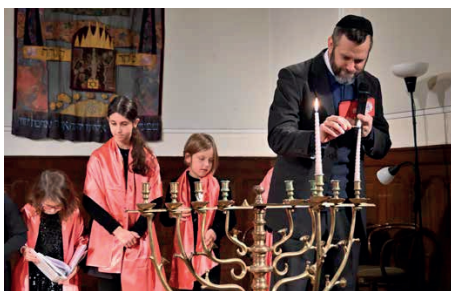
Vrchní pražský rabín David Peter zapaluje první svíci na chanukiji.