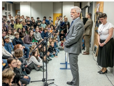
Návštěva prezidenta republiky Petra Pavla

Od roku 2021 přešel pod gesci Lauderových škol také židovský program třídy 1.B MŠ Na Výšinách. Je realizován ve třídě se specifickým programem pro židovské děti. MŠ zřizovaná městskou částí Praha 7 provozuje třídu s tímto programem už dvaatřicet let a je určena dětem předškolního věku přináležejícím k ŽOP. Na tuto třídu ŽOP finančně přispívá. Počet dětí je 25–28, tedy stejný jako v ostatních třídách. Děti jsou společně vedeny k židovským tradicím, historii a oslavě svátků. Strava pro děti je připravována v kuchyni školky v košer stylu.