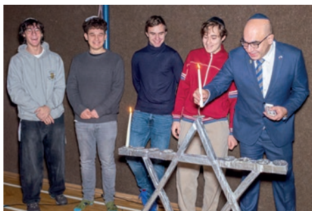
Zapalování prvního světla chanukie velvyslancem Státu Izrael Amirem Weissbrodem a studenty oktávy

Také v roce 2025 dotovala ŽOP významným způsobem činnost Lauderových škol (26,9 % rozpočtu školy). Lauderovy školy představují jedinečný vzdělávací projekt určený dětem, žákům a studentům se zájmem o výchovu v duchu židovství. Základní škola vznikla v roce 1997, od roku 1999 existuje gymnázium a od roku 2009 mateřská škola. Výuka na všech vzdělávacích stupních probíhá podle vlastního školního vzdělávacího programu Le chajim, vycházejícího