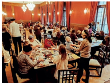
Komunitní chanuková oslava pro děti