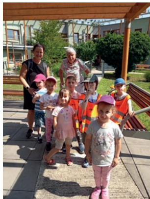
TKC – Sportovní den