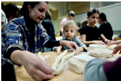
TKC – pečení chaly