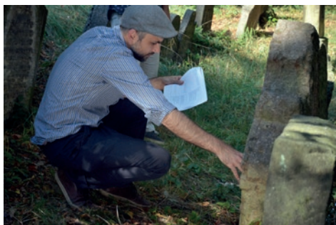
Starý židovský hřbitov na Žižkově – záchranné práce

Starý židovský hřbitov na Žižkově (SŽHŽ) – za nejvýznamnější akcí související s technickou správou a údržbou areálu lze v r. 2025 označit restaurování 29 poškozených a erozí ohrožených, historicky cenných náhrobků, vybraných převážně ve střední části hřbitovní plochy, v okolí hrobu významného rabína Landaua. Jednalo se o náhrobní kameny, které byly poškozeny vyvrácením, povalením, popraskáním nebo rozlomením, a také o náhrobky se zajímavou symbolikou a výtvarným zpracováním. Několik těchto náhrobků bylo poškozeno živelnými událostmi při odlomení a pádu části korun stromů ve vichřici, jiné byly vyjmuty z nevhodně vytvořeného betonového lapidária a poté restaurovány a osazeny na svá původní místa s využitím historických záznamů. Restaurátoři se souběžně s tím zabývali transferem 87 náhrobků a jejich dočasným uložením mimo svá původní místa, a to v souvislosti s přípravou opravy staticky havarijního úseku severní části ohradní zdi. Vlastní zahájení této významné stavební akce bylo přesunuto na 1. pololetí r. 2026. Pokračovala také podrobná dokumentace náhrobních nápisů, zaměřující se především na identifikaci osobních dat pohřbených a vkládání těchto dat do