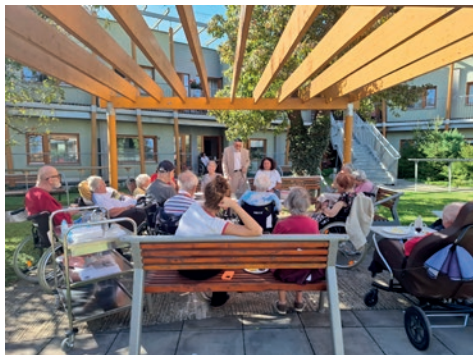
Páteční posezení pod pergolou

to s fotografií klienta a rodinám bylo umožněno uspořádat vzpomínkové setkání po roce od úmrtí jejich blízkého.