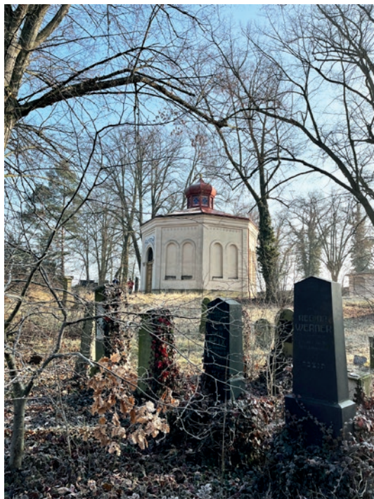
Židovský hřbitov v Mladé Boleslavi

Poměr sumy získaných dotací a darů vůči disponibilním prostředkům ŽOP (celkový rozpočet minus správní výdaje) dosáhl v r. 2025 úrovně 0,81, což znamená, že každá 1 Kč vynaložená z prostředků ŽOP jako spoluúčast k dotacím a darům přinesla 0,81 Kč navíc.