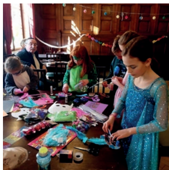
Purim pro děti – workshop