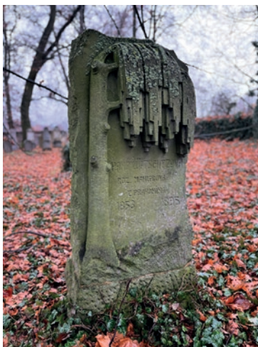
Hřbitov v Divišově – Měchnově

Původně plánovaný rozpočet SBH pro r. 2025 byl v důsledku několika objektivních příčin překročen o 585 tis. Kč při plnění 105,4 % . Hlavní důvody tohoto překročení spočívají ve větším objemu získaných dotací, které přinesly vyšší nároky na povinné kofinancování,