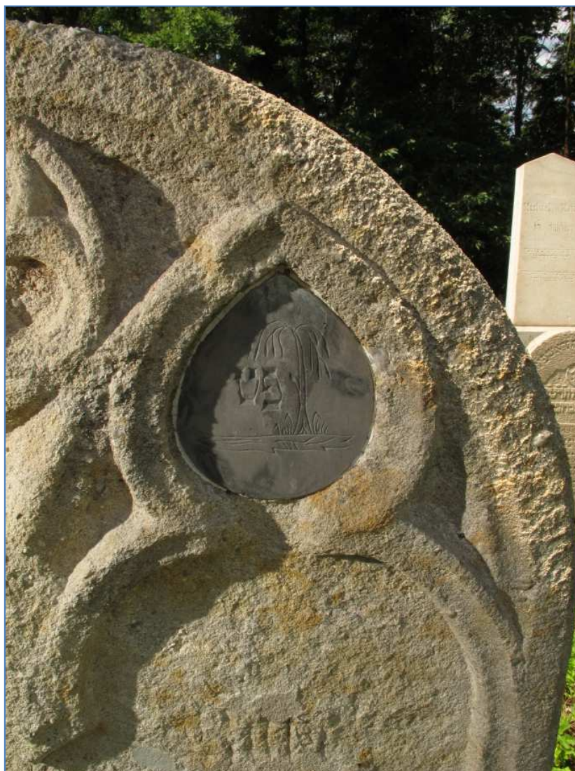
detail symbolu na náhrobku č. 350 na hřbitově v Tučapech