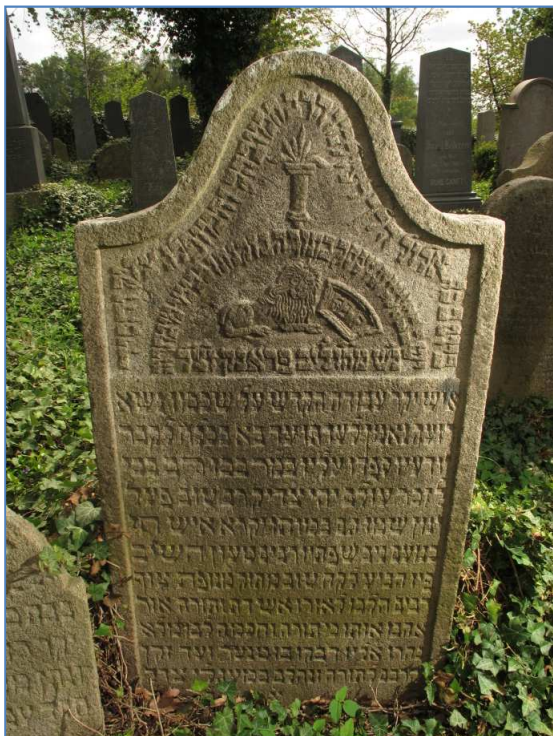
náhrobek č. 133