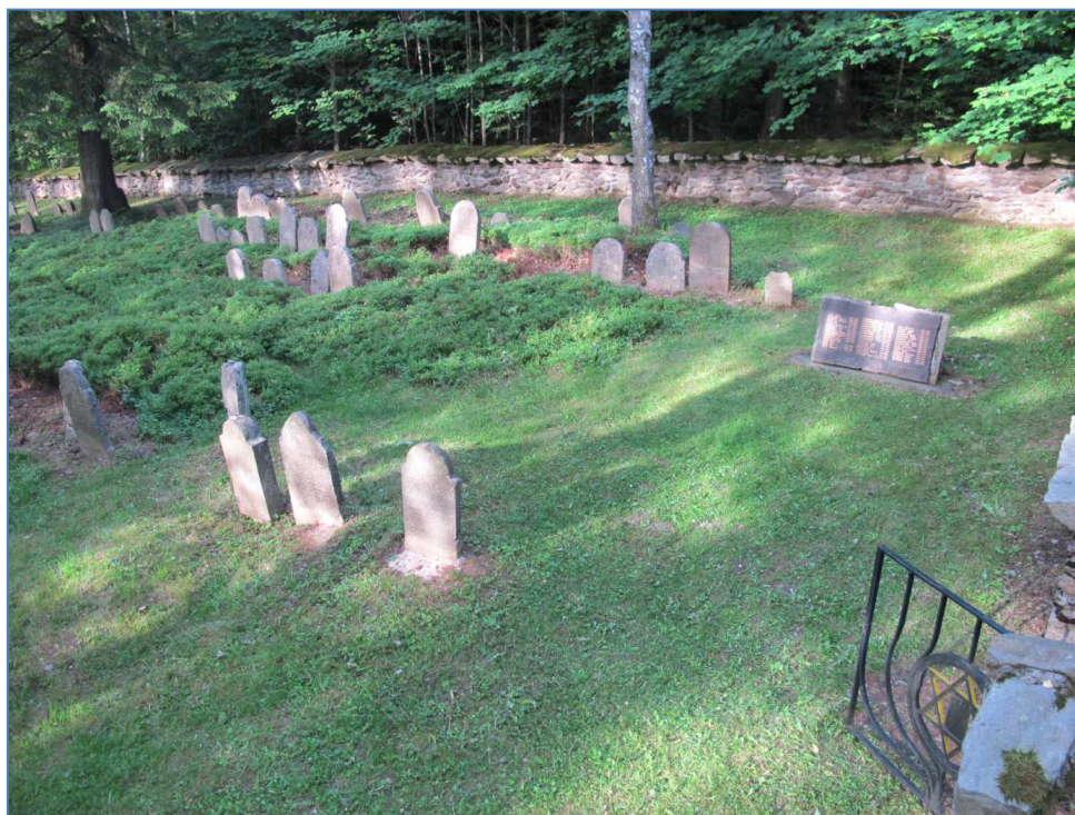
hřbitov v Kamenici nad Lipou vyčištěný od nežádoucí zeleně a připravený na fotografování

Hřbitov Stádllec je malých rozměrů ve značné vzdálenosti od židovských obydlí, přístupný cestou přes brod Oltyňského potoka. Přibližně sto dochovaných náhrobků, většinou z 19. století, asi 20 z nich z 20. století. Nejstarší náhrobky o několik let starší, než se dosud soudilo. Mezi významnými pohřbenými je např. gabaj spolku Chevra kadiša a místní židovský učitel. Ve Stádlci zaujmou česká jména zdejších Židů: Žalud, Sametz, Penížek, Upřímný, Vrba apod. Na několika náhrobcích z 20. Století symbol Davidovy hvězdy a růže, vyjadřující příjmení Rosenzweig.