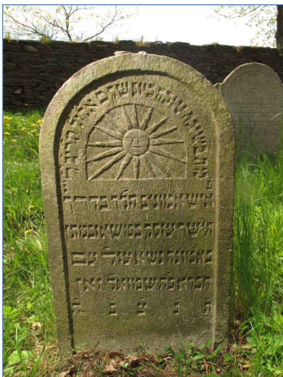
náhrobek č. 86